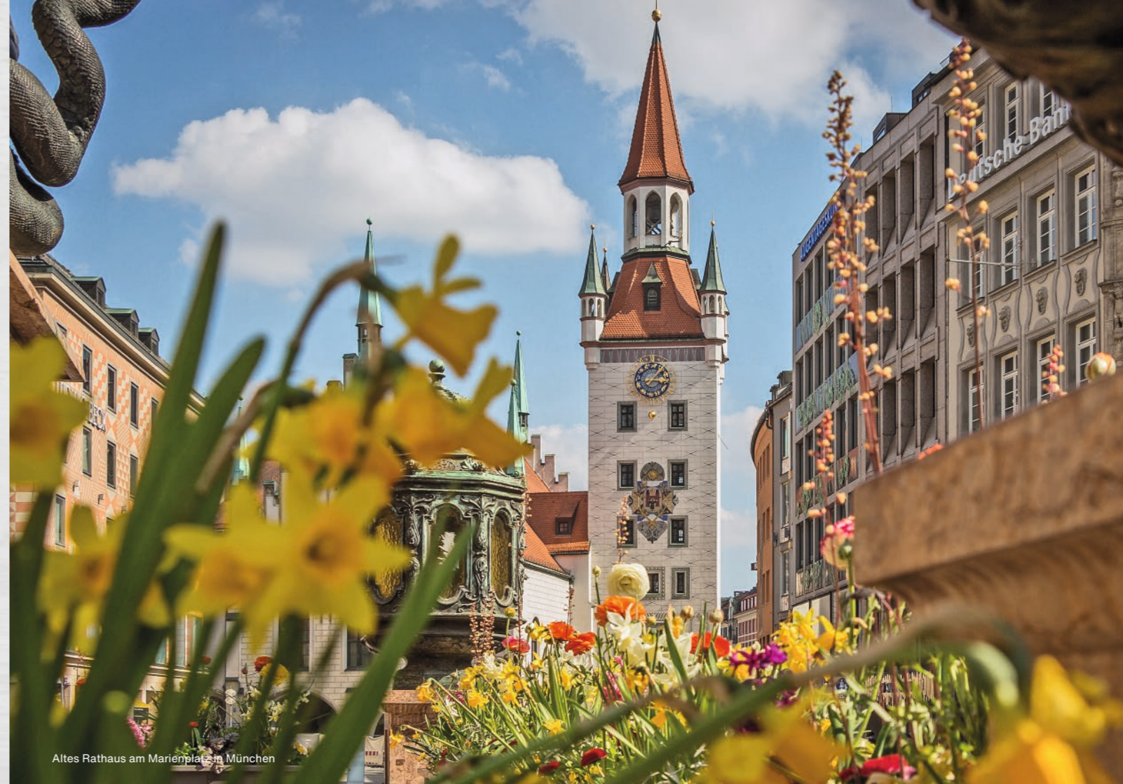
Altes Rathaus am Marienplatz in München