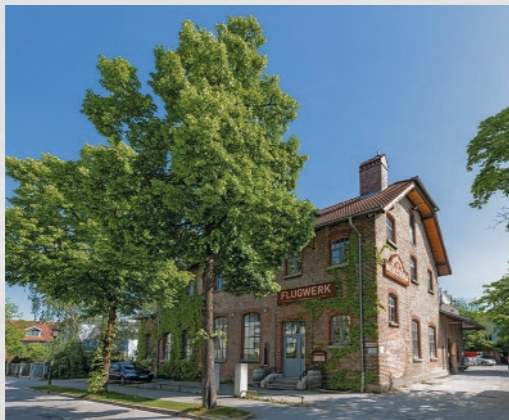
Ev. Kirche im alten Ortskern (rechts)