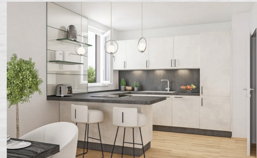
Abbildung oben: Die Einbauküche mit Geräten namhafter Hersteller.

Alle Illustrationen sind künstlerische Darstellungen – die Abbildungen können Abweichungen zum tatsächlich realisierten Gebäude aufweisen. Die dargestellten Möbel, die Beleuchtung und alle Accessoires sind nicht Bestandteil des Angebots.