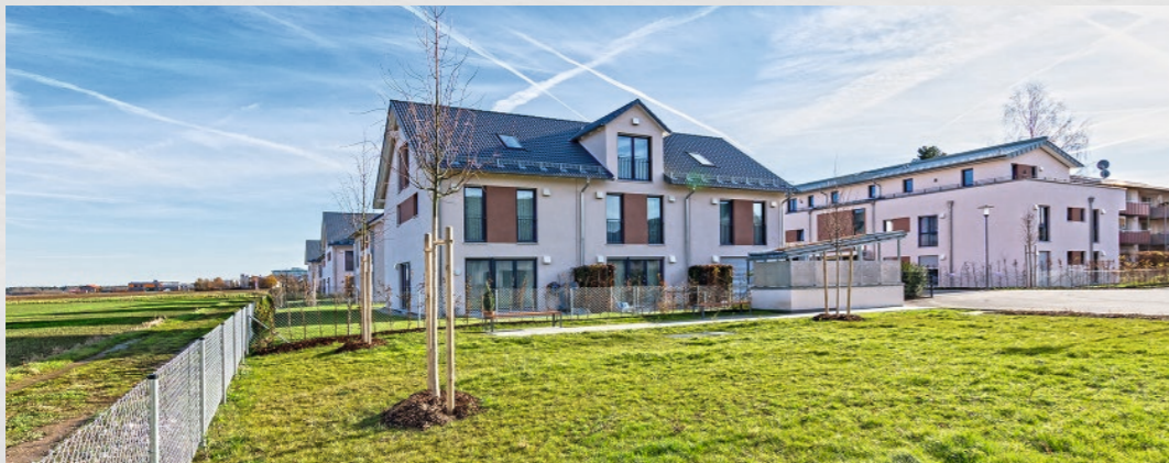
Foto: Eigentumswohnungen, Reihen- und Doppelhäuser Im Hirschwinkel, Höhenkirchen-Siegertsbrunn

Zahlreiche Eigentumswohnungen, Reihen-, Doppel- und Einfamilienhäuser wurden in der über 85 Jahre erfolgreichen Firmengeschichte der Pöttinger Immobiliengruppe realisiert.