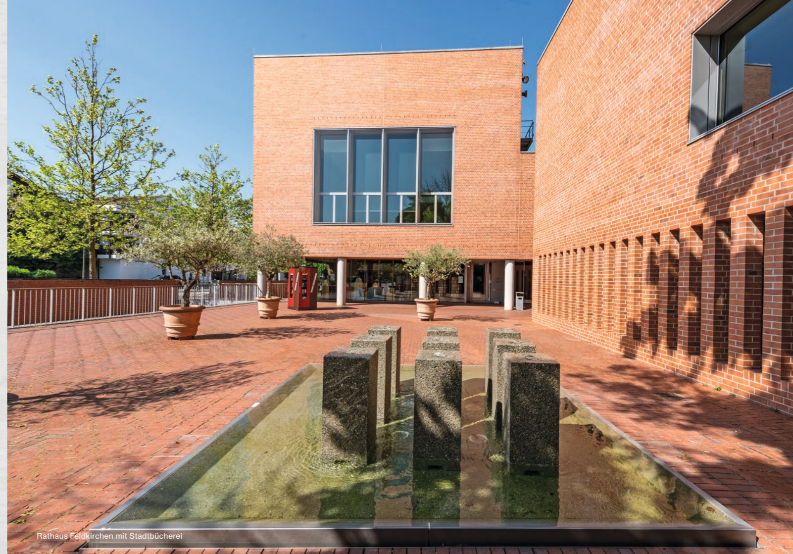
Rathaus Feldkirchen mit Stadtbücherei

In der Wohnanlage LINDEN31 entsteht in Zusammenarbeit mit der Gemeinde eine Kindertagesstätte.