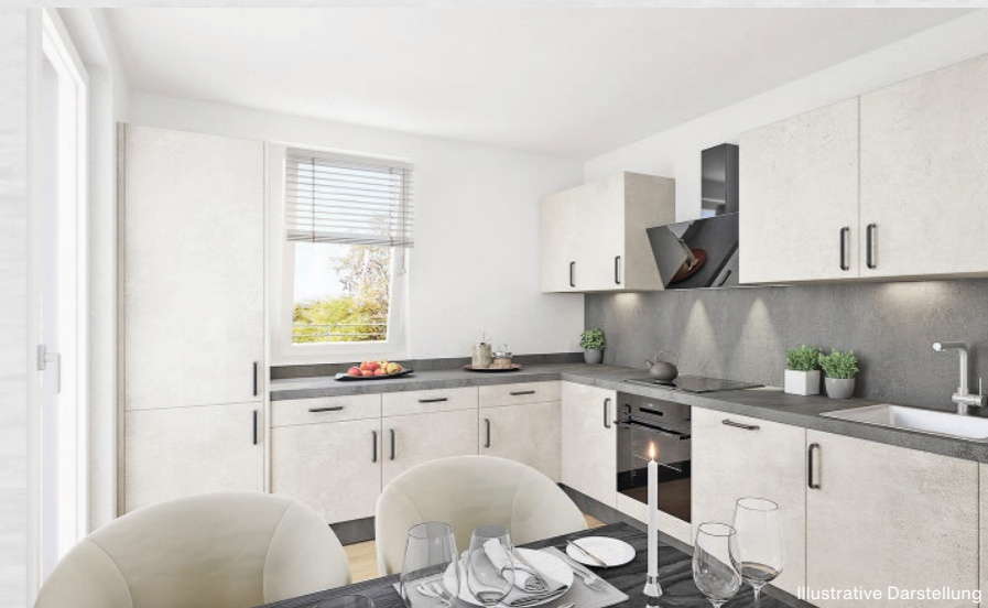
Abbildung oben: Die Einbauküche mit Geräten namhafter Hersteller.

Abbildung links: Blick über den Wohnbereich und auf den Balkon.